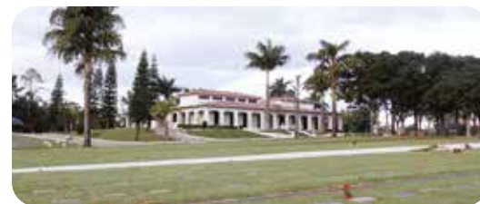
Cemitério Parque das Acácias