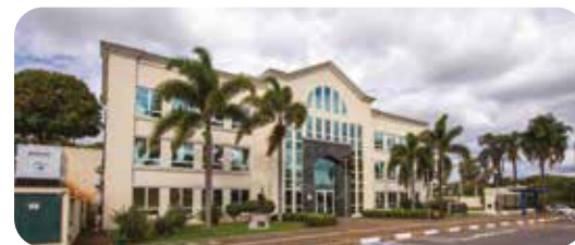
Cemitério Parque das Aleias

A atuação da Comunidade vai além da administração física. Cada detalhe – da arquitetura ao atendimento – é pensado para acolher as emoções de quem permanece. Destaque para a Capela de Todos os Santos, no Flamboyant, que celebra missas todos os domingos, às 10h30, e oferece um espaço de fé, silêncio e reconexão com a espiritualidade. Mais que despedidas, nossos cemitérios são refúgios de memória e amor. São lugares onde a história de Campinas também repousa com serenidade.