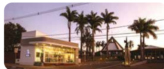
Cemitério Parque Flamboyant