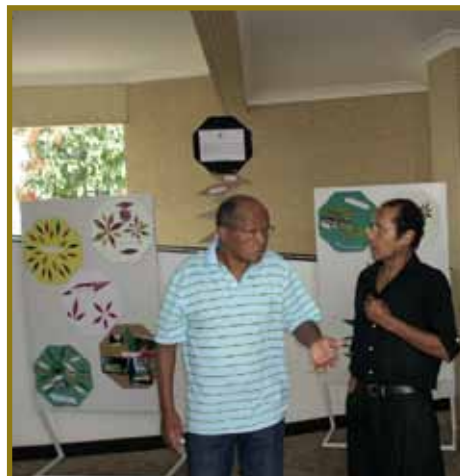
Exposição de arte na programação