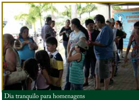
Dia tranquilo para homenagens