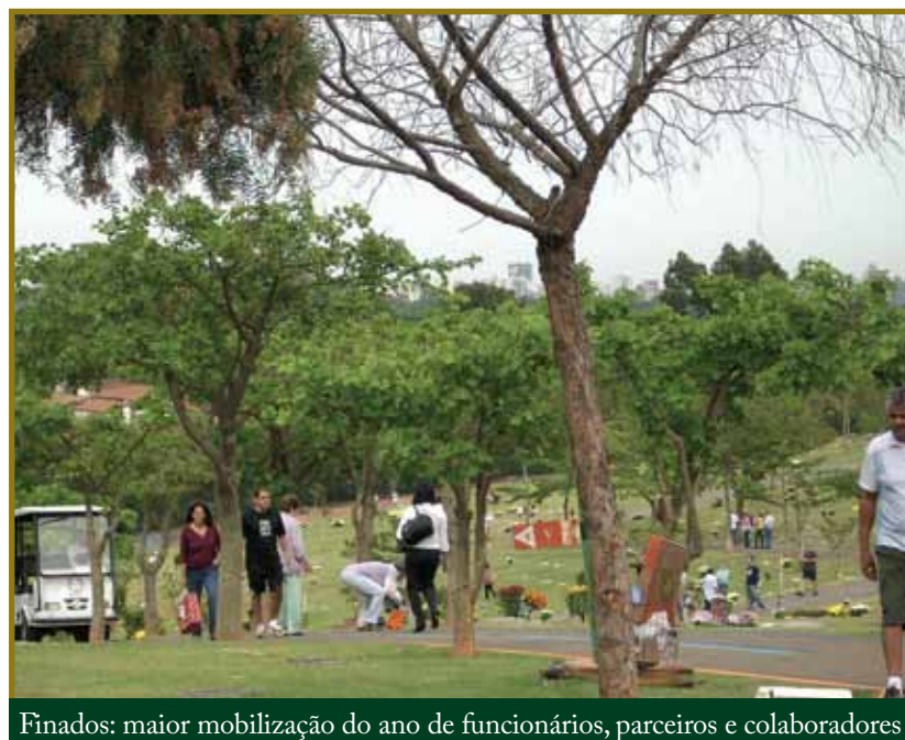
Finados: maior mobilização do ano de funcionários, parceiros e colaboradores

No Flamboyant e Aléias, anualmente, Finados muda a rotina dos cemitérios. A data mobiliza todos os colaboradores e envolve parceiros, que somam atenção e esforços para a data de maior público no ano. Diversos pontos de atendimento aos cessionários e visitantes foram disponibilizados e funcionários empenharam-se em atividades extras para que a estada no dia consagrado das homenagens fosse a mais agradável possível.