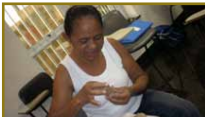
Vivência: trabalho em argila, em abril