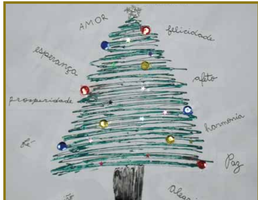
Desejos de Natal dos alunos da EJA