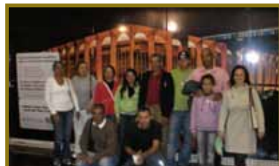
Visita a Viracopos, em maio