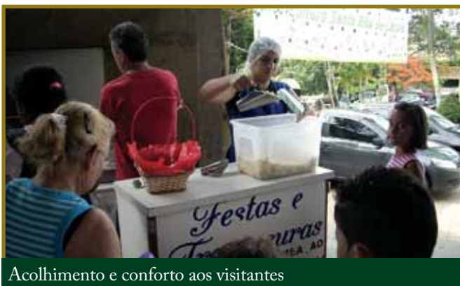
Acolhimento e conforto aos visitantes