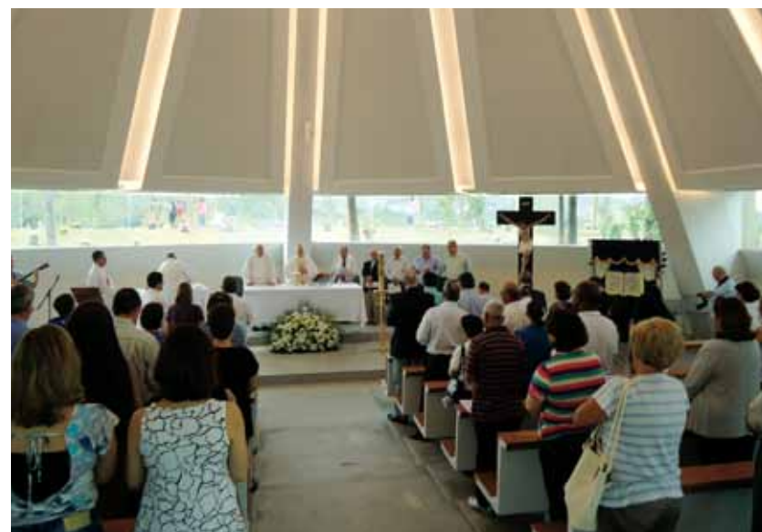
Missa de reinauguração foi celebrada no último dia 1º de novembro

Todos os domingos, às 10h30, há celebração de missa na Capela de Todos os Santos.