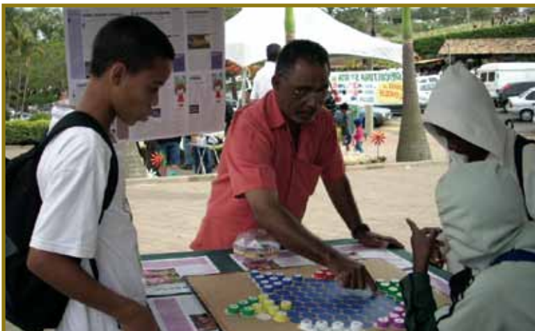
Oficina de brinquedos reciclados, em parceria com a EcoBrinquedoteca