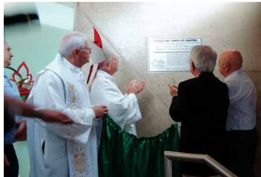
Descerramento da placa que inaugurou a Capela de Todos os Santos

40 anos. No novo projeto, os visitantes são acolhidos em um ambiente que traduz calma, sobretudo através da natureza, que invade a capela por meio das belas paredes de vidro.