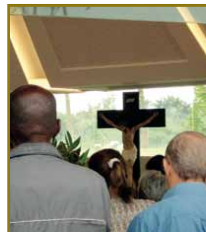
Missas durante todo o dia