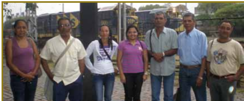
Visita ao Ceprocamp - biblioteca e informática, em setembro