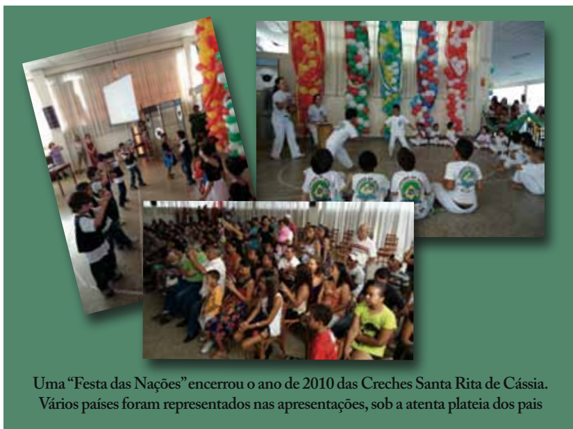
Uma “Festa das Nações” encerrou o ano de 2010 das Creches Santa Rita de Cássia. Vários países foram representados nas apresentações, sob a atenta plateia dos pais

ajudar na captação de recursos, o Brechó, batizado de Dasru, foi reinaugurado, em novo e mais espaçoso local. “Dessa forma, estamos otimistas que 2011 será um ano ainda melhor; pretendemos ampliar nosso quadro de sócios-contribuintes e organizar no mínimo três eventos para arrecadar fundos para nossos trabalhos”, disse a coordenadora.