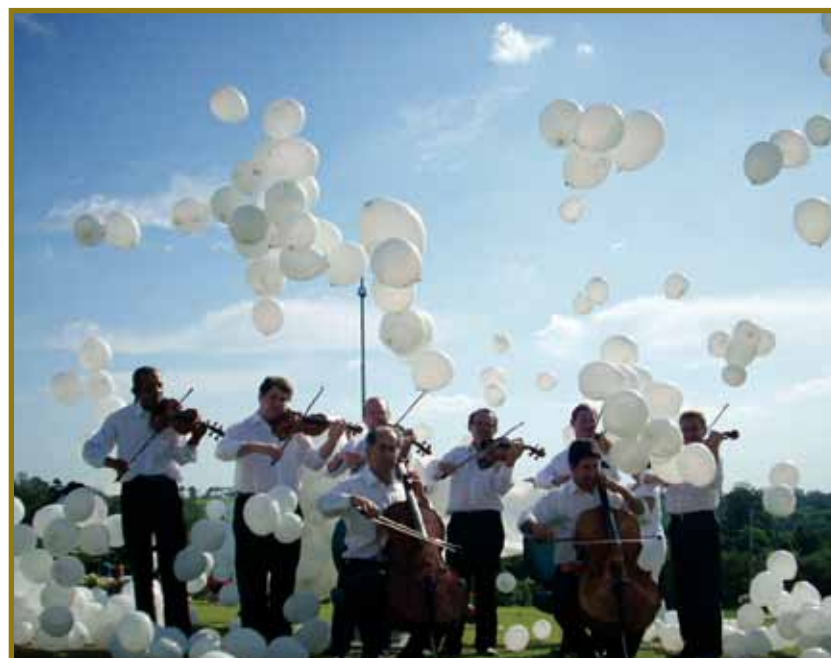
Grupo ArcoBaleno Musical: novidade na programação deste ano