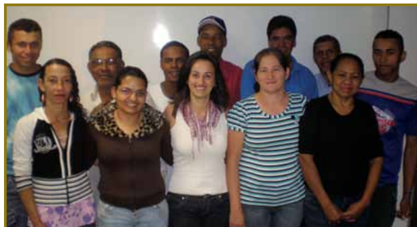
Encerramento Festivo do 1º Semestre letivo, em julho

liação e reflexão sobre nossas vivências, experiências e, no âmbito escolar, sobre nossas aprendizagens. “Muitas foram as atividades que realizamos juntos e alguns destes momentos importantes de nossa trajetória neste ano letivo de 2010 ficaram registrados em fotografias”, conta a professora. Uma parte dessa “retrospectiva” o leitor pode acompanhar nesta página.