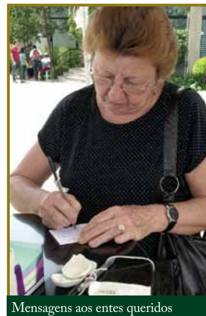
Mensagens aos entes queridos